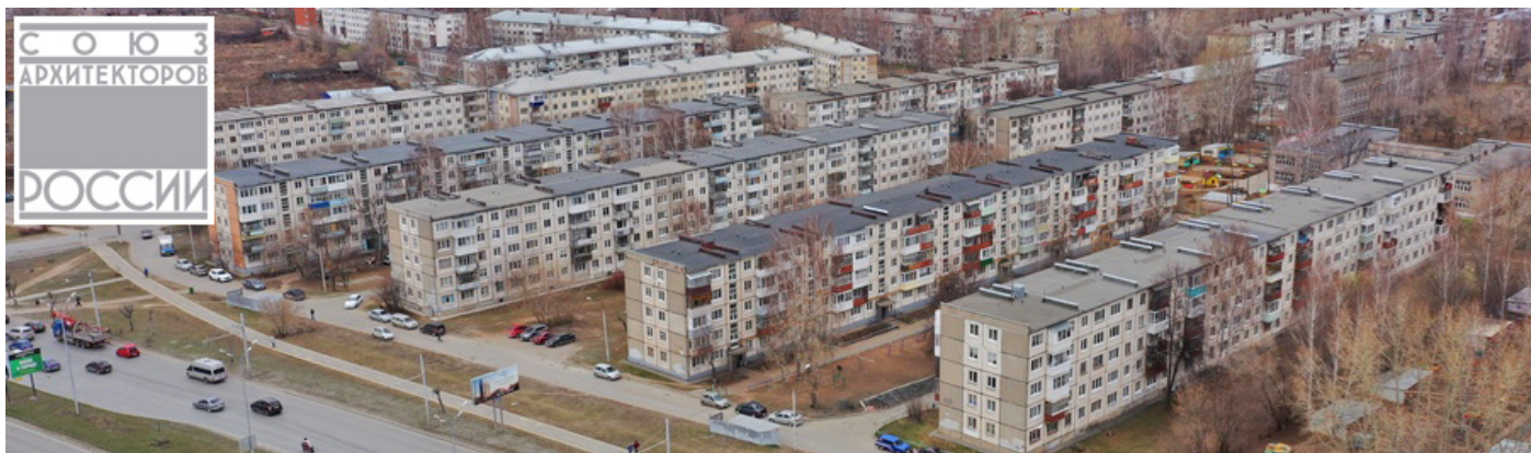
Конкурс проектов капитального ремонта фасадов жилых домов серии 1-335 в Ижевске, 2019